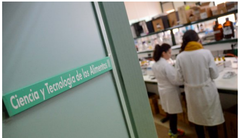
Alumnos de Ciencia y Tecnología de los Alimentos en la Escuela de Ingenierías Agrarias en Badajoz. :: C. M.

Hablan los alumnos, que también ponen nota. Según su criterio, hay tres titulaciones de la UEx en las que sus estudiantes están encantados: se trata del grado en Trabajo Social, que se imparte en el centro adscrito Santa Ana de Almendralejo, el de Educación Infantil que también se estudia en esta sede universitaria, y el más valorado por los jóvenes es el de Ciencia y Tecnología de los Alimentos, que se imparte en la Escuela de Ingenierías Agrarias de Badajoz, única titulación de la UEx a la que los estudiantes conceden un sobresaliente, concretamente un 9,38.